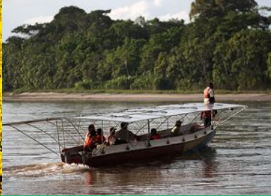
KURZFILM KARA SOLAR