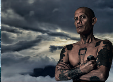
THE BORNEO CASE