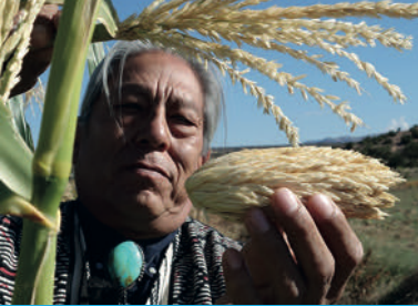
SEED: THE UNTOLD STORY