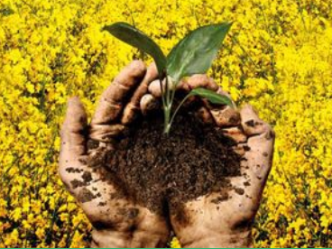
CODE OF SURVIVAL