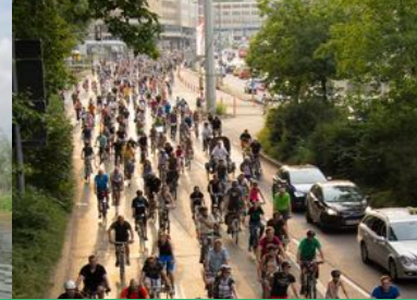
FAHRRAD KINO KESSELROLLEN