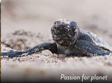
Passion for planet