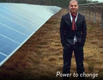
Power to change