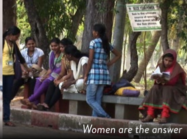
Women are the answer